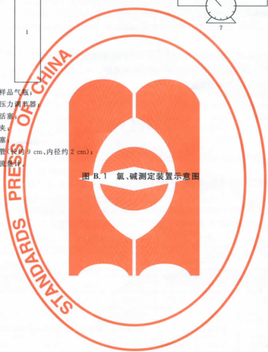
图 B.1 氯、碱测定装置示意图