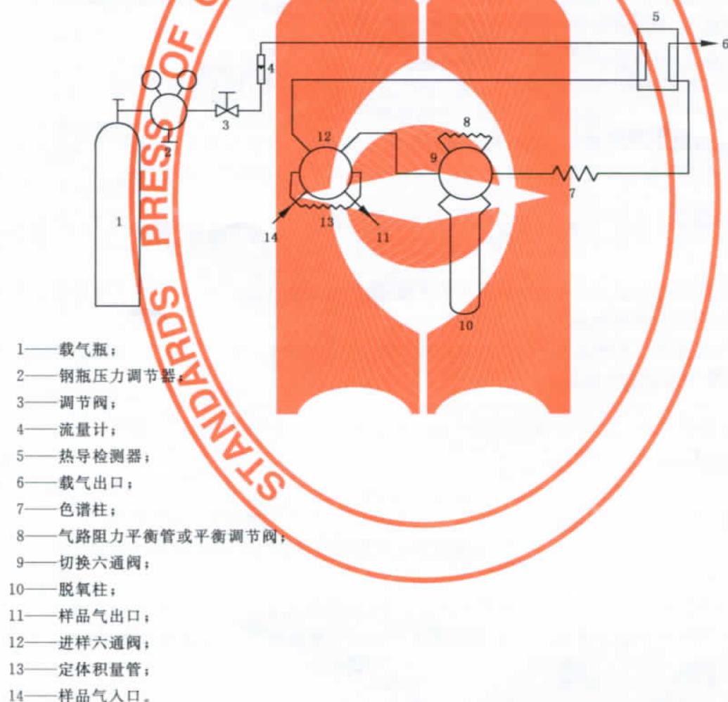
图 A.1 气相色谱仪气路流程示意图

热导气相色谱仪。要求所采用的气相色谱仪对氢中氧(氩)、氮的检测限(体积分数)不大于 10 \times 10^{-6} 。仪器安装及调试按仪器说明书进行。图 A.1 给出了气相色谱仪的参考气路流程示意图。